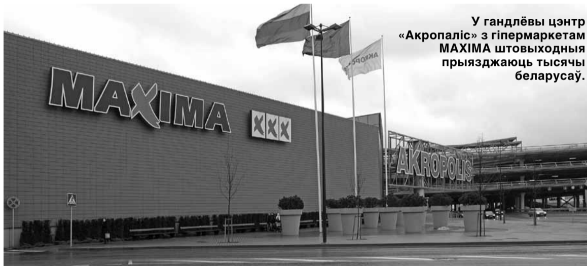
У гандлёвы цэнтр «Акрополіс» з гіпермаркетам МАХІМА штовыходныя прыязджаюць тысячы беларусаў.

На момант здачы нумару ў друк так і не было ясна: ці то «Махіма» аператыўна «асадзіла назад»,