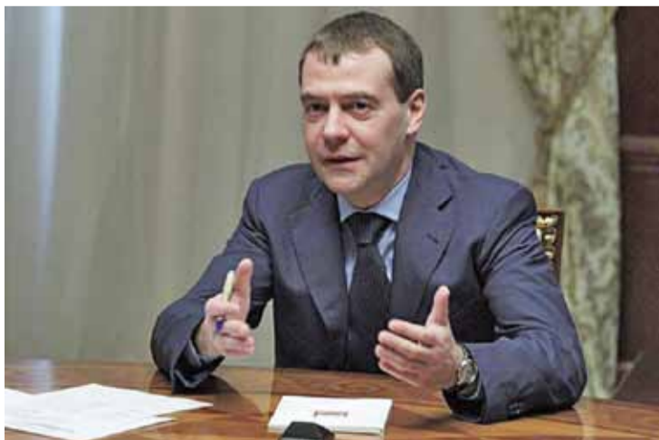
«Пагалілі ўжо»: Дзмітрый Мядзведзеў змяніў імідж — фотафакт. Прэзідэнцкі тэрмін Мядзведзева канчаецца 7 мая.