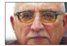
Камертон Сяргея Ваганавы

лена Нойнер выдуць на змаганне за Вялікі крышталёвы глобус. У Магдалены зараз спрынт, пагоня і масстарт. 1093 балы, у Дар'і — 1061. Алег Гардзёнка