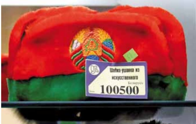
Прадаецца такая рэч у мінскім ЦУМе. Звярніце ўвагу: шапку зрабілі ў Бабруйску са штучнага футра. Як жартуюць у каментых на пп.бу, каб была бел-чырвона-белага колеру, то зрабілі б з натуральнага футра.