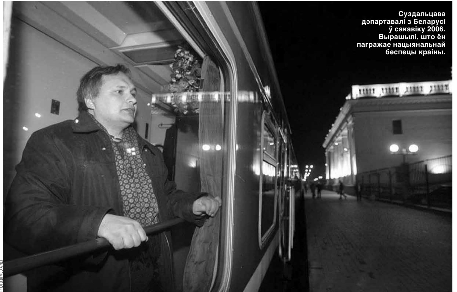
Суздальцава дэпартавалі з Беларусі ў сакавіку 2006. Выраслі, што ён пагражае нацыянальнай беспяцы краіны.

яшчэ ў савецкія часы была прыстойная толькі ў дзвюх галінах, гэта політэхнічная і лінгвістычная. Беларусы двухмоўныя, таму ім іншыя мовы лёгка даваліся. Усё гуманітарнае было кандовае, а стала яшчэ горш. Гэта не