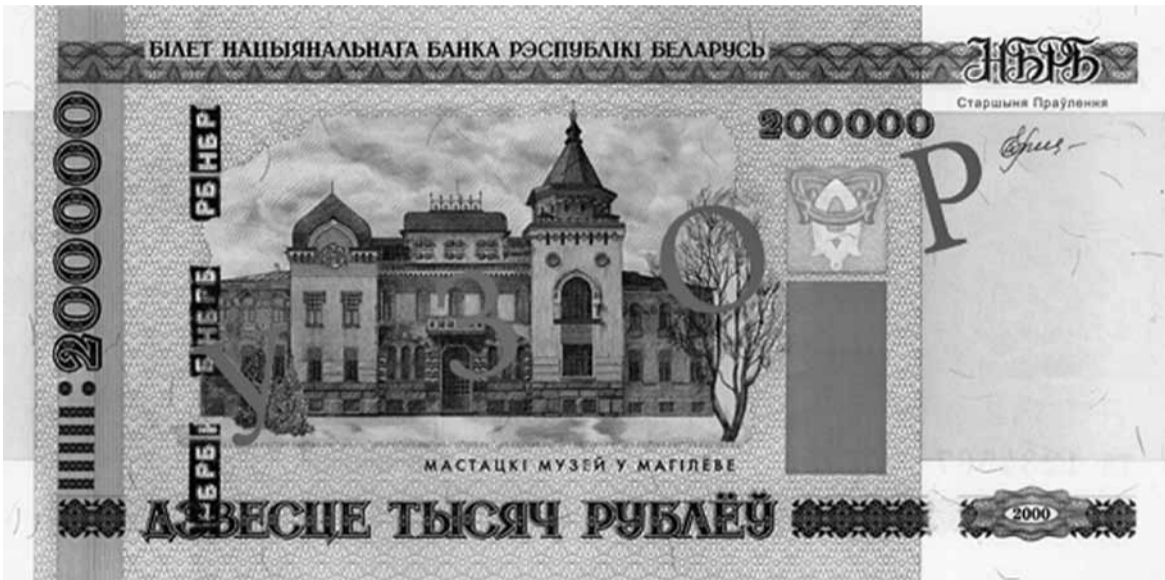
На пярэднім баку магілёўскі мастацкі музей...