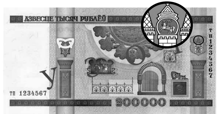
...а на адваротным — калаж з яго архітэктурных элементаў.

Будынак з'яўляецца помнікам архітэктуры пачатку XX стагоддзя, у ім спалучыліся рысы ма-