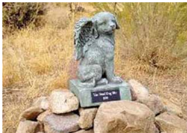
Падобныя могiлкі нярэдка ўтвараюцца стыхійна, як у Бабруйску.