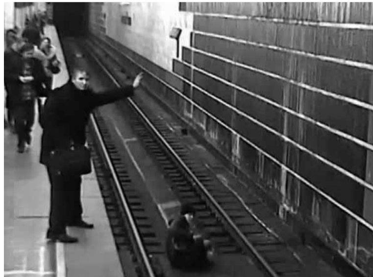
Супольнымі намаганнямі пасажыры і супрацоўнікі метро станцыі 10 студзеня 2012 выратавалі дзяўчыну, якая скочыла на рэйкі.

Восень 2011 для супрацоўнікаў метро таксама была няпростай. На рэйках падземкі загінулі два чалавекі (у тым ліку 16-гадовая дзяўчына), адзін чалавек быў траўмаваны. У пачатку снеж-