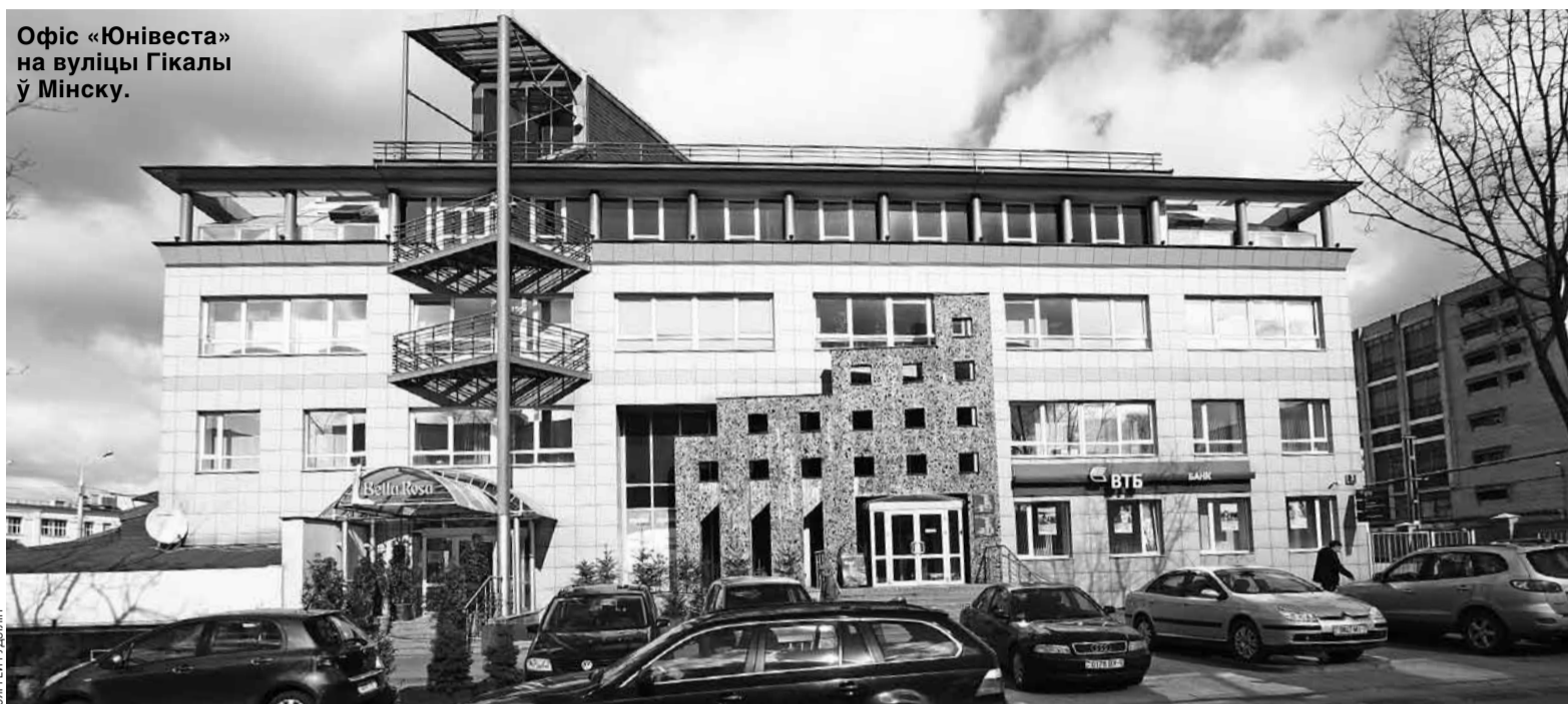
Офіс «Юнівеста» на вуліцы Гікалы ў Мінску.

Першыя кантакты з нашай краінай наладзіліся ў яго ў 1998. Беларусь і Расія ўтварылі сумеснае прадпрыемства «СлаўНафта» (галоўны актыву — Мазырскі НПЗ), у якім Тарнаўскі даслужыўся да пасады віцэ-прэзідэнта па сувязях з СНД.