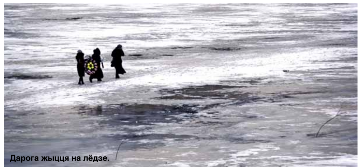
Дарога жыцця на лёдзе.

Коля і Іра — асвейская моладзь. Працуюць на пару качагарамі ў мясцовым калгасе. На дваіх пасля апошняга павышэння заробку