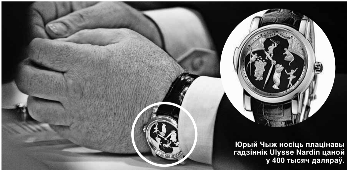
Юрый Чыж носіць плацінавы гадзіннік Ulysse Nardin цаной у 400 тысяч даляраў.

Агулам «чорны спіс» уключае 243 асобы на чале з Аляксандрам Лукашэнкам і 32 кампаніі.