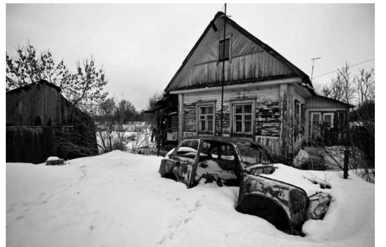
Дом у Асвеі можна купіць за 700 тысяч.

яна пасаромелася назваць. Прыехала сюды з Мурманска — мужа адправілі на торфпрадпрыемства працаваць. Глядзіць на працы LCD-тэлевізар, які можна набыць у крэдыт, але стаіць ён тут ужо даўно, раскладвае малаткі, пральны пара-