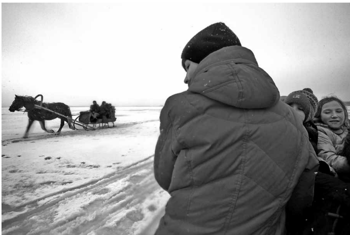
У святы па возеры катаюцца на конях.