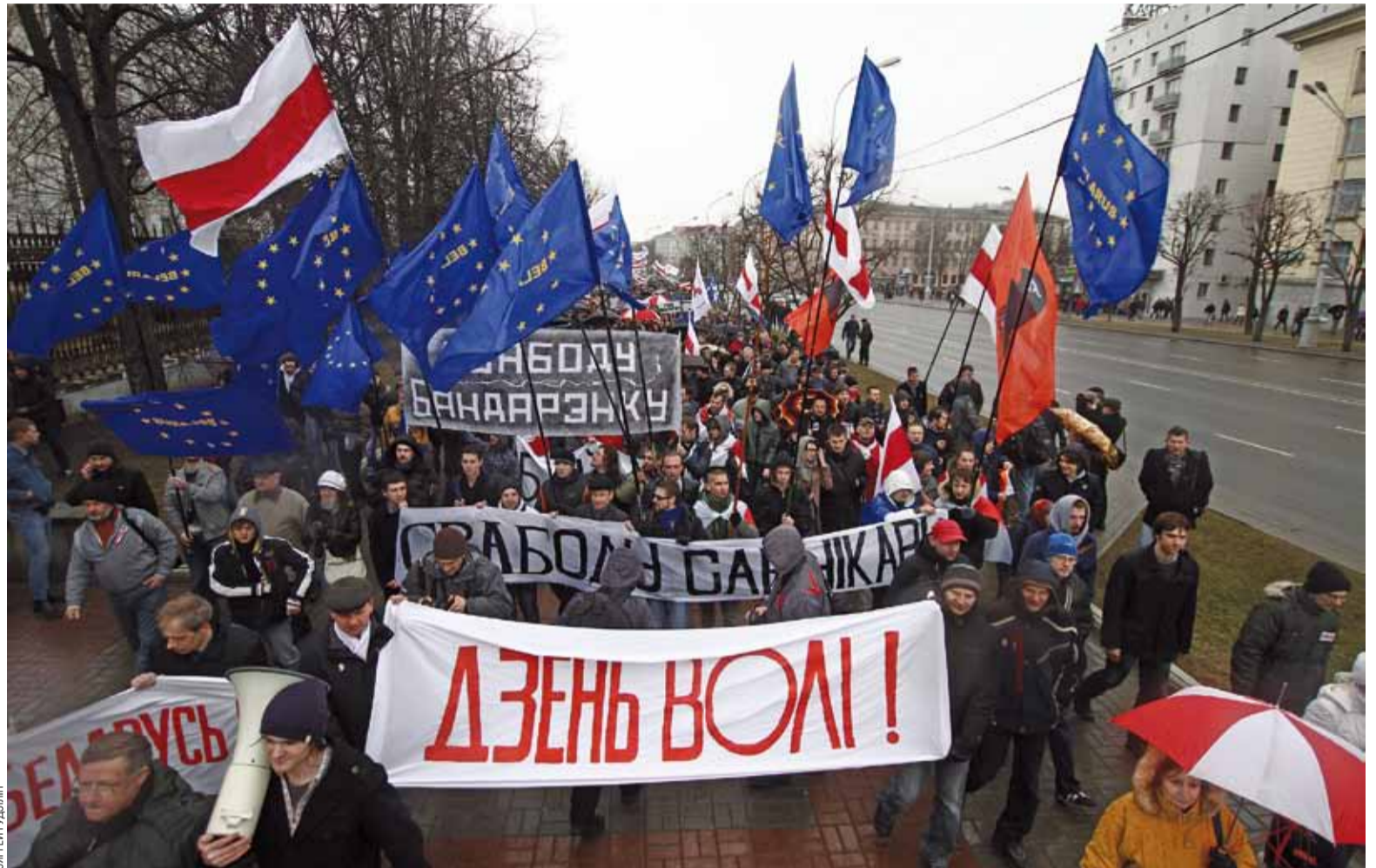
Дзень Волі быў найбольш масавай акцыяй апазіцыі ад часоў Плошчы.