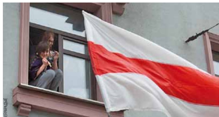
Жыхары навакольных дамоў пазітыўна рэагавалі на бел-чырвона-белыя сцягі.