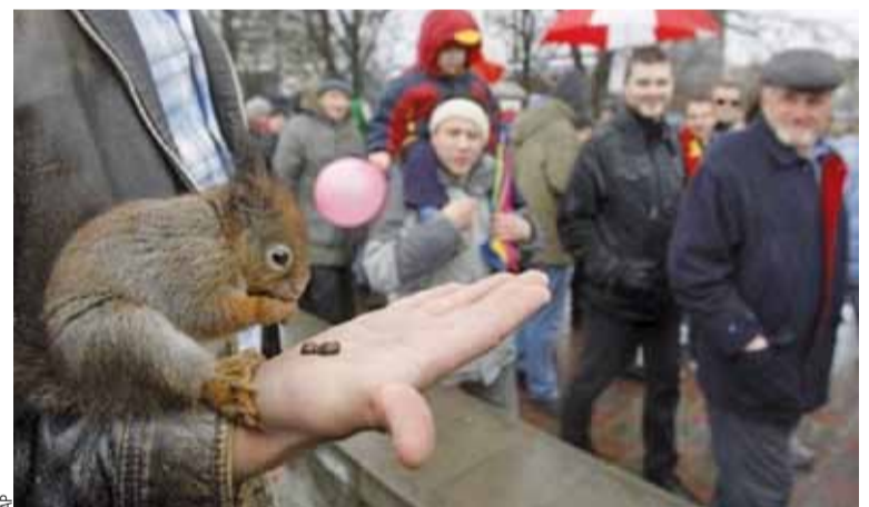
Удзельнік акцыі корміць вавёрку.