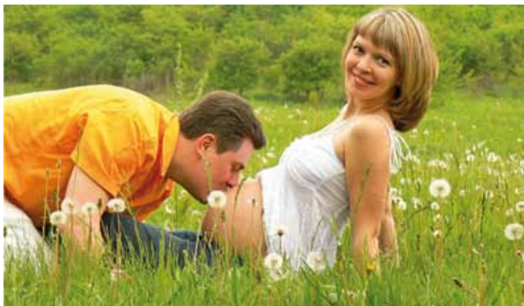
Партнёрскія роды робяцца ўсё больш папулярнымі ў беларусаў.

Прысутныя на родах маладыя таты часцей плачуць, чым млеюць »