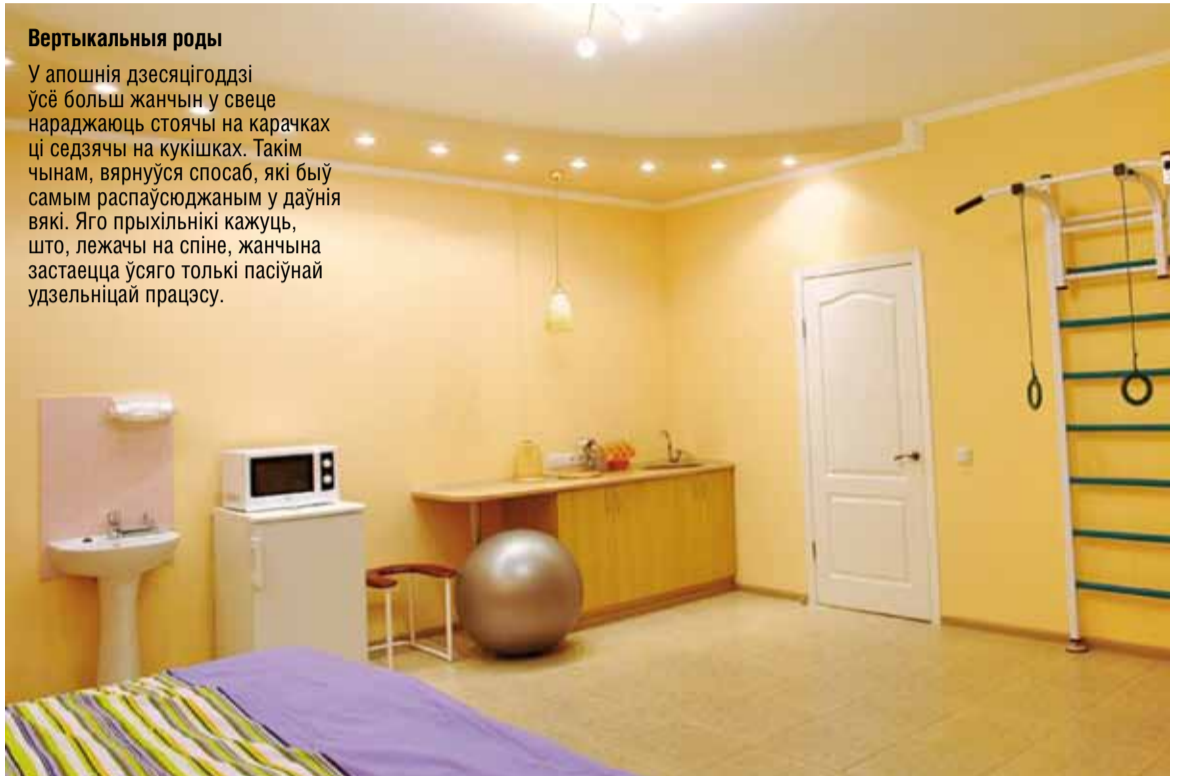
Так выглядаюць сучасныя родавыя залы. Такія ёсць ва Украіне.

У апошнія дзесяцігоддзі ўсё больш жанчын у свеце нараджаюць стоячы на карачках ці сядзячы на кукішках. Такім чынам, вярнуўся спосаб, які быў самым распаўсюджаным у даўнія вякі. Яго прыхільнікі кажуць, што, лежачы на спіне, жанчына застаецца ўсяго толькі пасіўнай удзельніцай працэсу.