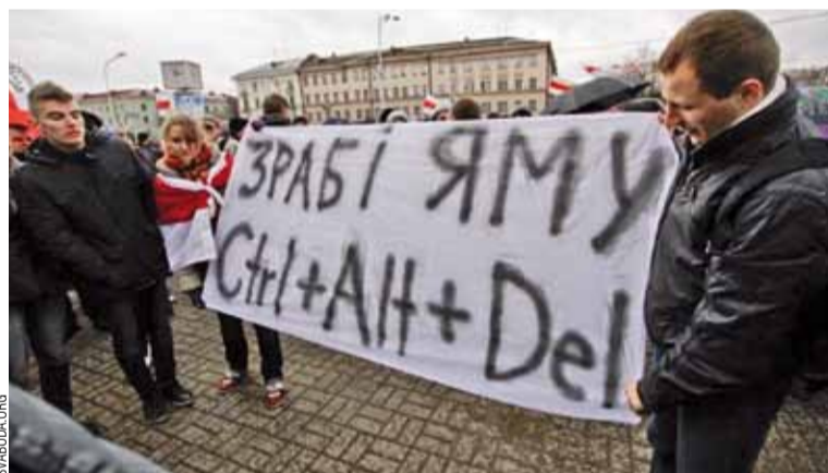
Акцыя была дазволена, таму многія прыйшлі са смелымі лозунгамі.