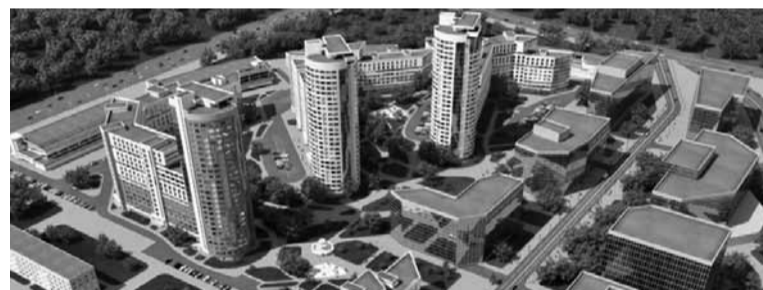
Комплекс «Каскад» на месцы турмы.

Паралельна «Юнівест-М» атрымлівае элітныя ўчасткі Мінска для забудовы. На месцы турмы на вуліцы Кальварыйскай, напрыклад, сканчаецца будаўніцтва