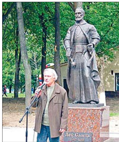
У Лепелі ўрачыста адкрылі помнік слаўтаму канцлеру ВКЛ Льву Сапегу. У свой час ён валодаў гэтым горадам. Ініцыяваў стварэнне помніка прабашч мясцовай каталіцкай парафіі ксёндз Андрэй Аніскевіч.