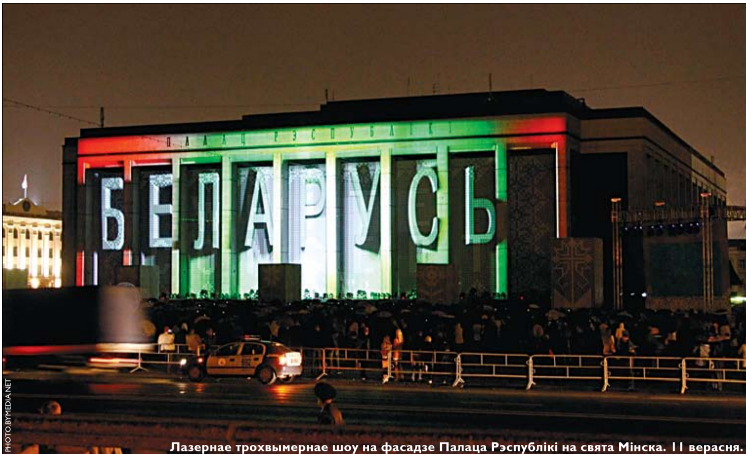
Лазернае трохвымернае шоу на фасадзе Палаца Рэспублікі на свята Мінска. 11 верасня.