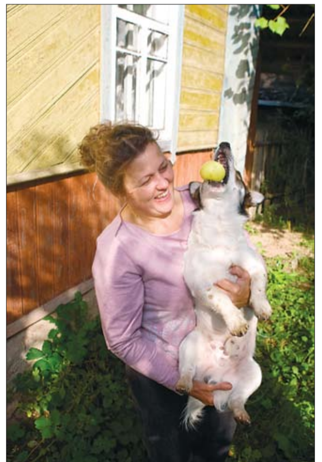
Сабака Бам — верны спадарожнік кандыдата.