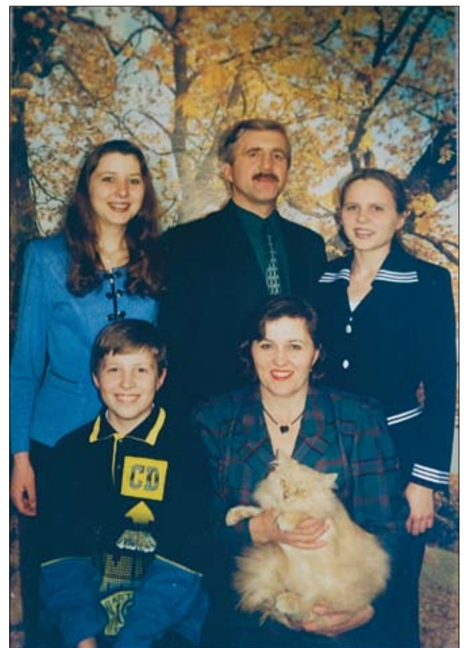
Трыццаць гадоў шчаслівага сямейнага жыцця і трое цудоўных дзяцей — дзве дачкі і сын.