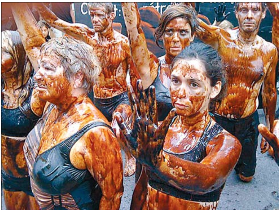
Канада. Пратэст супраць дзейнасці нафたвых кампаній напярэдадні Сусветнага энергетычнага кангрэса.