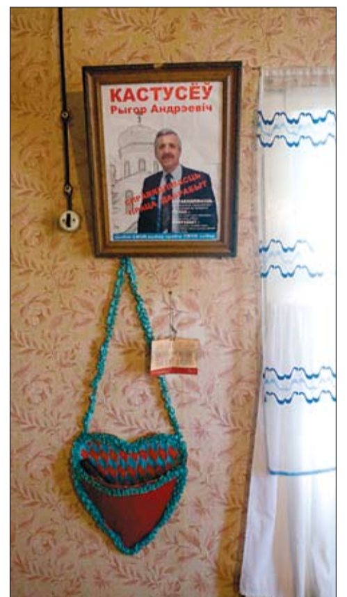
Партрэт Кастусёва ў хаце павесіла ягоная мама.

— Паабячайце, што яшчэ прыедзеце, — гасцінна запрашалі нас гаспадары. Мы і не думалі аднеквацца.