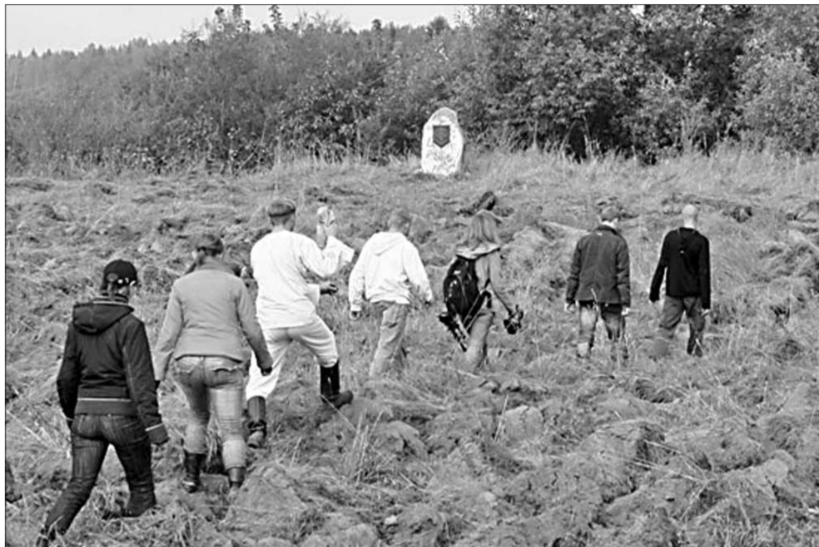
Палямі сцякаліся людзі на поле бітвы.

бел-чырвона-белы сцяг, запыталіся ў сабранных, ці знаёмы ім тэрмін «калабарацыянiзм». Затым паведамілі, што знаходжанне некалькіх чалавек у лесе ля агню трапляе пад артыкул Закона аб масавых мерапрыемствах і кожны з сабранных бярэ ўдзел у несанкцыянаваных дзеяннях.