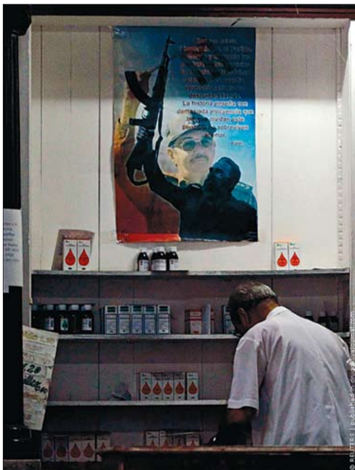
Фідэль Кастра прызнаўся ў гутарцы з амерыканскім журналістам, што «кубінская мадэль развіцця краіны больш не пасуе нават нам». А потым узяў свае словы назад: маўляў, меў на ўвазе не Кубу і сацыялізм, а ЗША і капіталізм. На фота: аптэка ў Гаване.