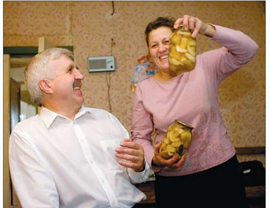
Неўзабаве на стол падалі і іншыя далікатэсы: перац з грады, марынаваныя баравікі.

ведаю добрыя. Вы да нас наступным разам на даўжэй у госці прыезджайце. У грыбы сходзім, лазню зацэплім.